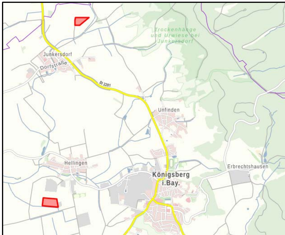
Abb. 2: Lage im Ort, Bayerische Vermessungsverwaltung 2021