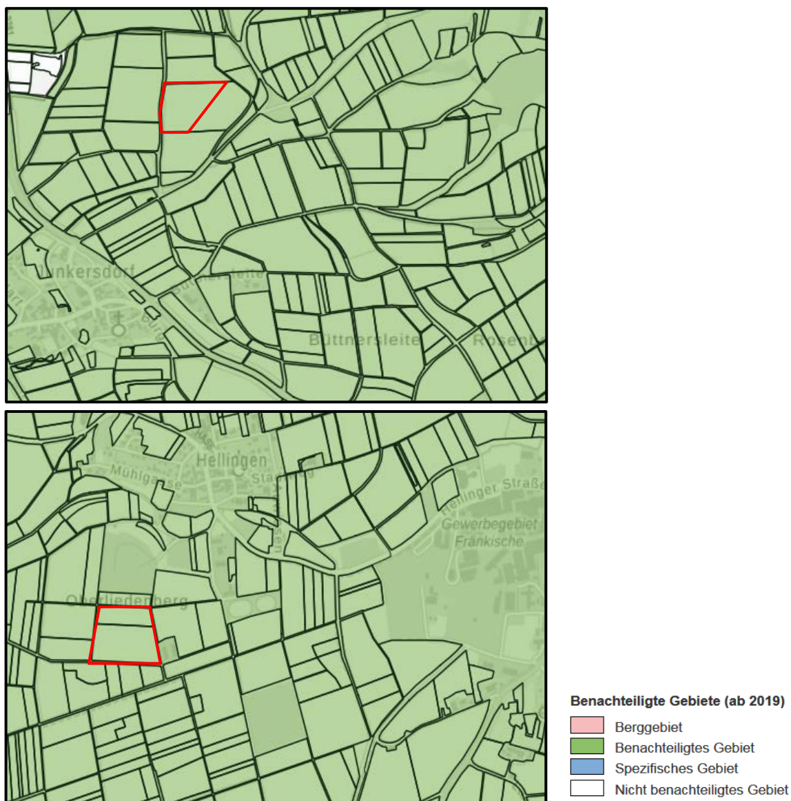
Abb. 4: Benachteiligtes Gebiet, Bayerisches Staatsministerium für Ernährung, Landwirtschaft und Forsten

Die geplante Photovoltaik-Freiflächenanlage erfüllt somit diese Anforderungen an den Standort und gleichzeitig handelt es sich hier um einen Standort, der bereits vorbelastet ist durch: